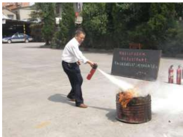
驾驶员消防演练和培训

公司建立有完备的突发事件应急预案。并每年进行检查，通过现场随机抽查提问等方法加以巩固，让每个人了解发生突发事件是应该做什么。每年公司都要组织预案的演习。每次演练都有计划和评估，主要是《消防应急预案演习》。通过演习，不仅让大家熟悉了流程、明确了职责，同时也让广大员工进一步感受到了事故预防的重要性和紧迫感，极大地提高了全体员工的安全防范意识和应急处置能力。