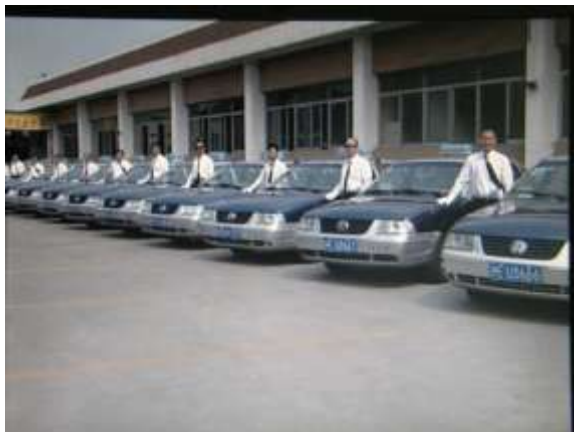
精神焕发的驾驶员队伍和车辆